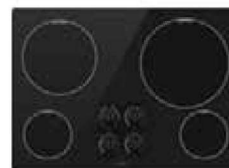
TABLE DE CUISSON